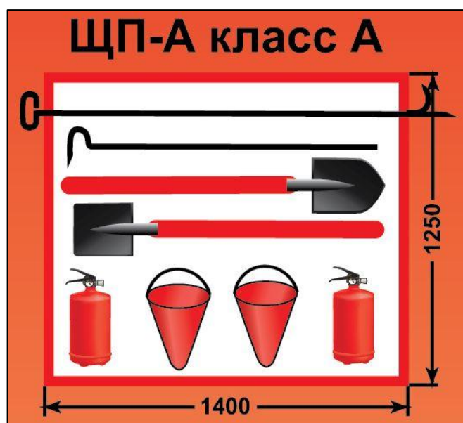
ЩП-А – щит пожарный для очагов пожара класса А