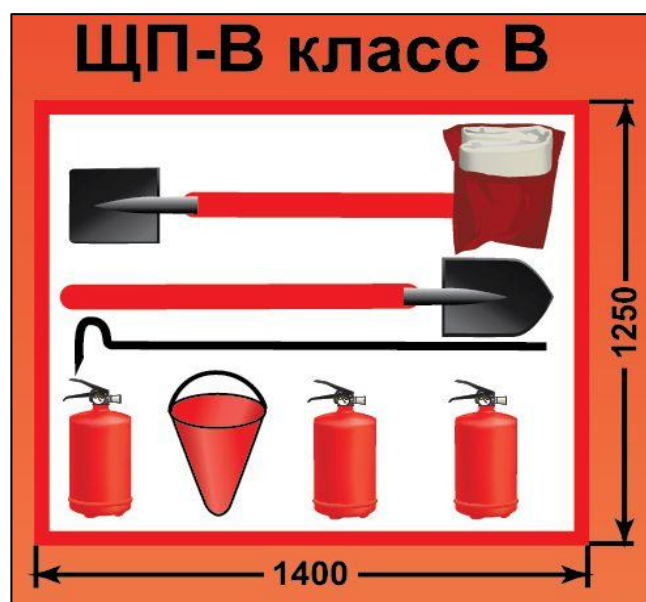
ЩП-В – щит пожарный для очагов пожара класса В