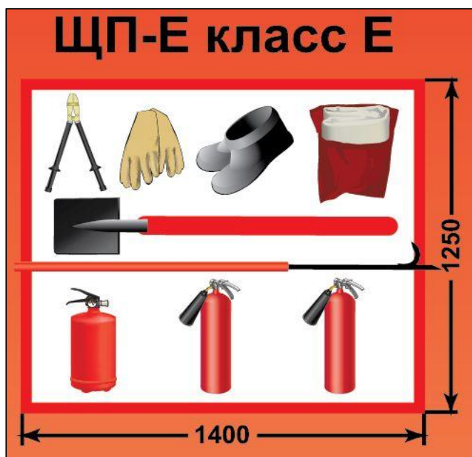
ЩП-Е – щит пожарный для очагов пожара класса Е