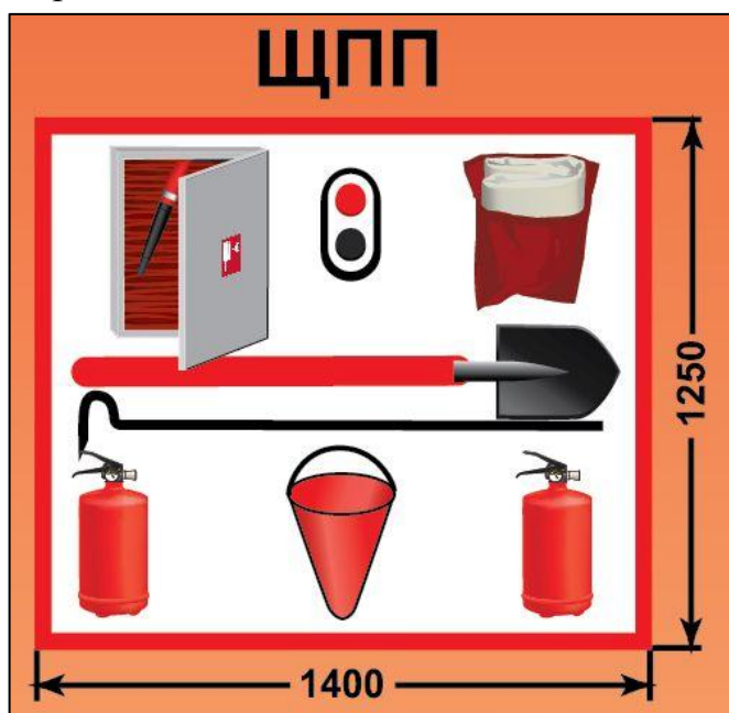
ЩПП – щит пожарный передвижной