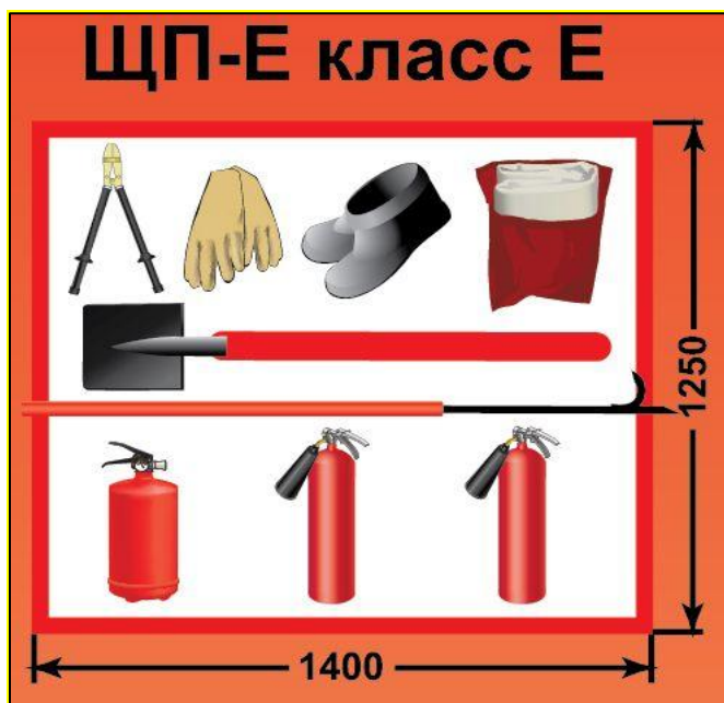
ЩП-Е – щит пожарный для очагов пожара класса Е