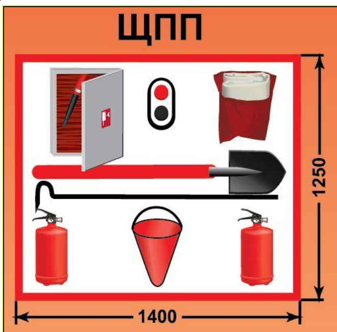
ЩПП – щит пожарный передвижной